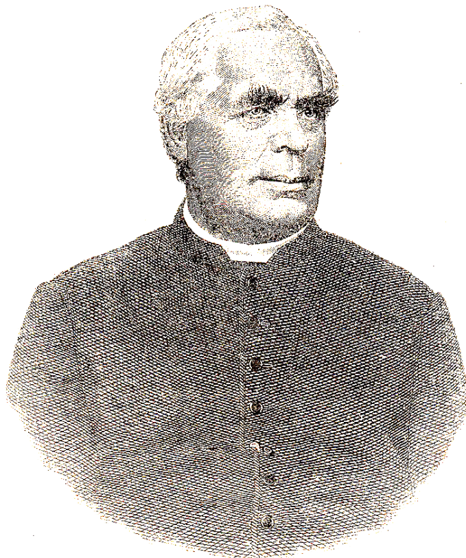
Sebastian Kneipp (17.05.1821 – 17.06.1897)