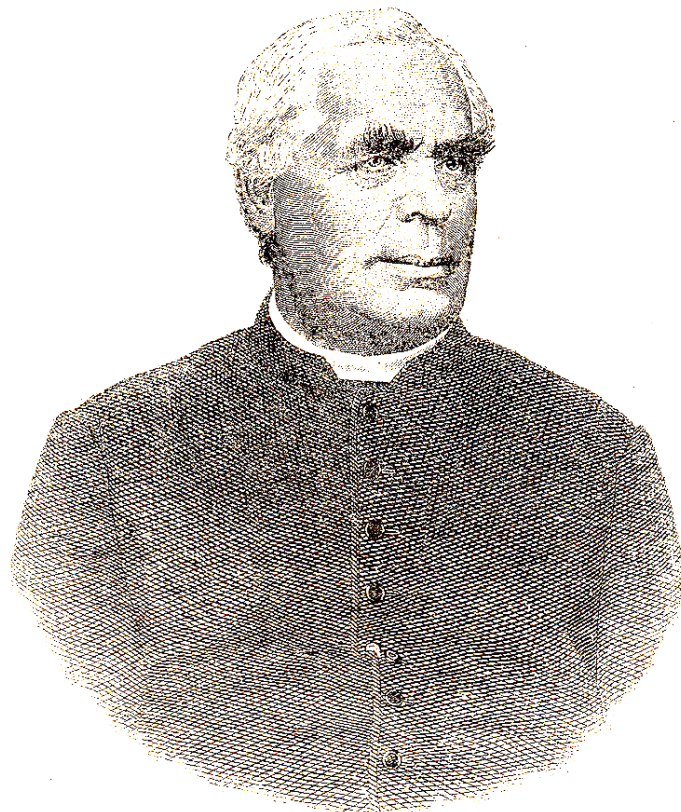
Sebastian Kneipp (17.05.1821 – 17.06.1897)

Kneipp-Verein Bad Nenndorf e. V. Der Vorstand